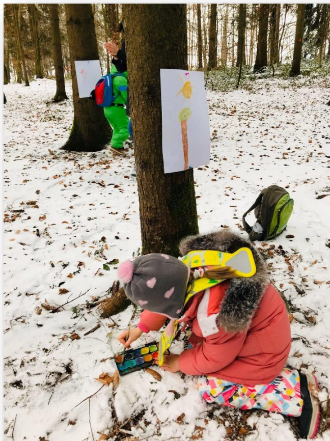
Activités créatrices en forêt

École en forêt : un matin par semaine et par tous les temps, les élèves de la 1 H à la 4 H se rendent en forêt pour y poursuivre leur apprentissage. Là aussi, des aptitudes multidisciplinaires sont développées grâce aux compétences pédagogiques et méthodologiques des enseignant.es qui les accompagnent.