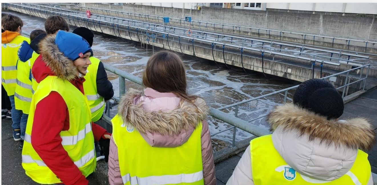
Visite de la STEP Fribourg