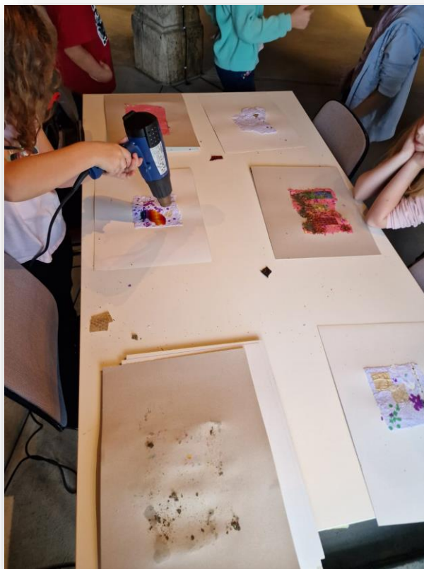
Visite du musée Gutenberg

L'idée est de faire découvrir aux élèves une activité pédagogique, culturelle, sportive ou économique. Le but est que l'enfant développe une pensée ouverte, curieuse, créative et aussi critique. En décroissant les apprentissages et en ouvrant l'école sur le monde extérieur, les enfants sont mieux préparés aux enjeux d'un apprentissage plus diversifié et complexe.