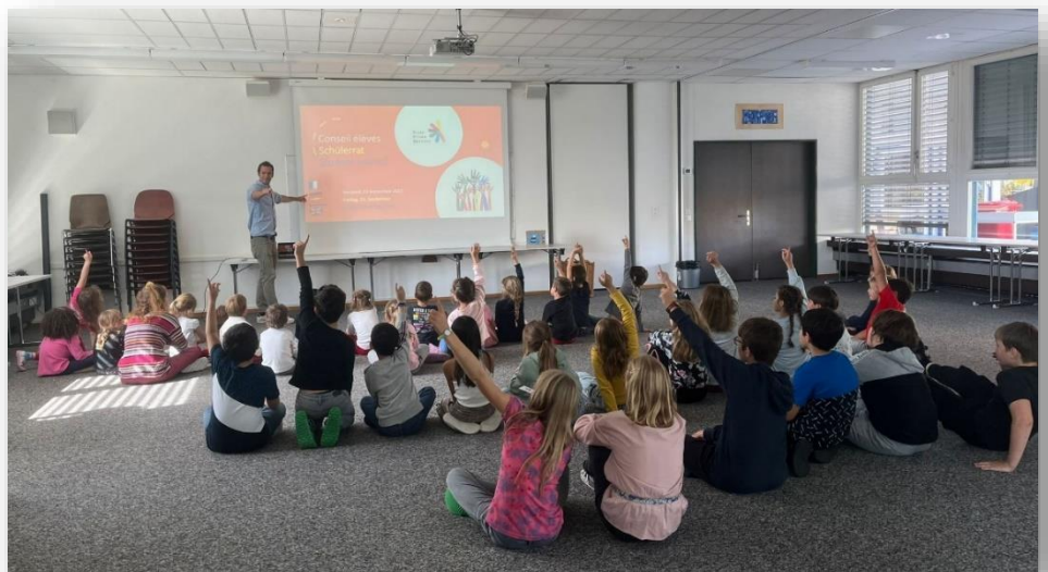
Conseil des élèves

Les objectifs de l'école sont compatibles avec le programme de l'école publique du canton de Fribourg et le Plan d'études romand (PER). Le retour à l'école publique pour le niveau secondaire se passe en toute sérénité grâce au bon niveau scolaire des élèves, à leurs aptitudes, leur assiduité au travail et leur comportement respectueux. La très grande majorité d'entre eux intègrent les classes PG au cycle d'Orientation.