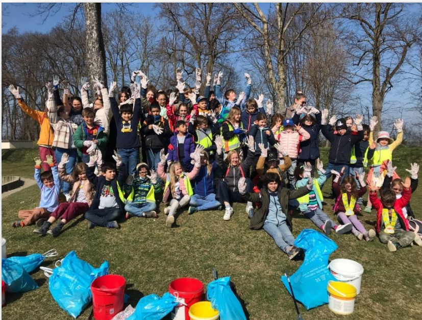
Journée coup de balai

Obtention du label Eco-schools : il s'agit du plus grand programme international d'éducation