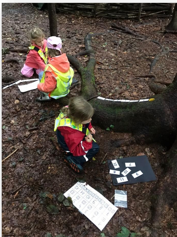
Mathématiques en forêt

En devenant la salle de classe, la forêt permet de maintenir une forte motivation à apprendre. Les enfants apprennent en immersion et au contact de la nature. Les effets positifs sur le développement physique et psychique des enfants sont notables (évacuation du stress, activité physique, confiance en soi...)